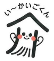
(イメージキャラクター)