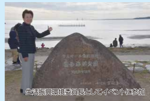
生活振興環境委員長としてイベントに参加