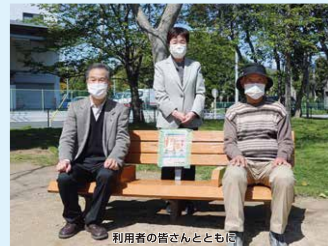
利用者の皆さんとともに