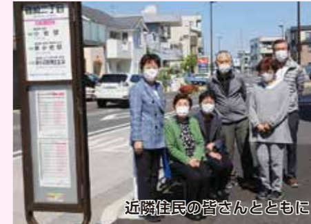
近隣住民の皆さんとともに